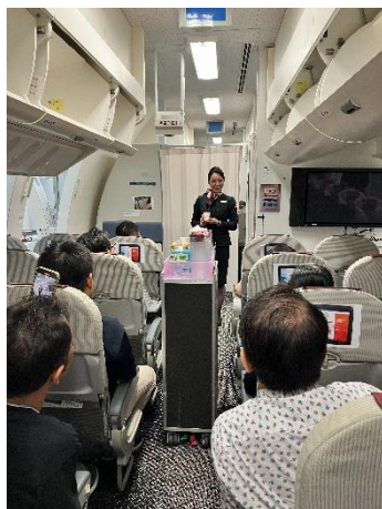
ドリンクサービス体験