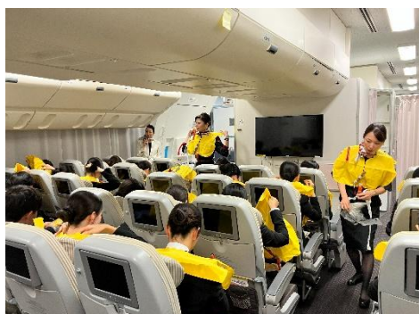
救命胴衣膨張体験