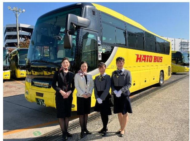
JAL 客室乗務員とはとバスガイド