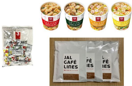
客室乗務員おすすめ お土産セット