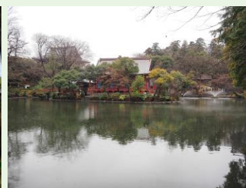
井の頭池(イメージ)

本リリースは国土交通記者会、都庁記者クラブに同時配布しています。 本件に関する報道関係の方からのお問合せは 下記までお願いいたします。