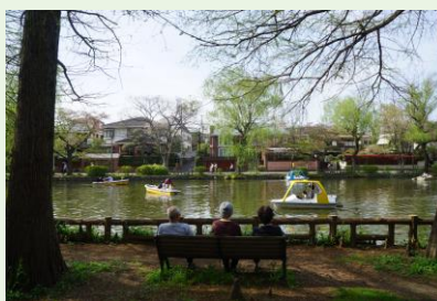
石神井池(イメージ)

予約サイト: https://www.hatobus.co.jp/course/2024/spring/R7457?c_id=PR