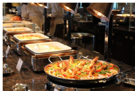
バイキングの昼食 ※イメージ

行程:東京駅丸の内南口(10:50発)＝迎賓館赤坂離宮(本館内部と主庭、前庭の見学)＝帝国ホテル 東京「インペリアルバイキング サール」(誕生65周年！リニューアルオープン。バイキングの昼食)～帝国ホテル 東京「ガルガンチュワ」(ショッピング、10%割引の優待付)＝東京駅丸の内南口(16:40着予定)