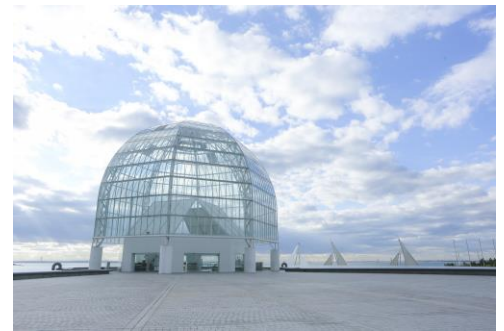
葛西臨海水族園(イメージ)

行 程：東京駅丸の内南口(9:00発)＝葛西臨海水族園(入園)＝オリエン タルホテル東京ベイ「グランサック」(ブッフェの昼食)＝東京スカイツ リー天望デッキ・東京ソラマチ(自由散策)＝東京駅丸の内南口 (16:50着予定)