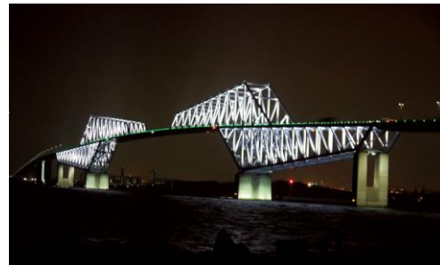
東京ゲートブリッジ(車窓/イメージ)