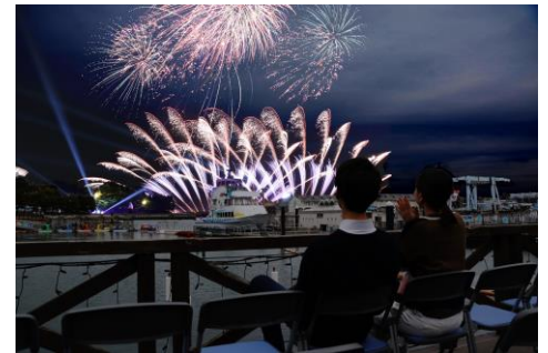
横浜・八景島シーパラダイス 花火シンフォニア(イメージ)