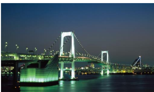
レインボーブリッジ(車窓/イメージ)

行 程：東京駅丸の内南口(18:50発)～築地～汐留～レインボーブリッジ～お台場～東京ゲートブリッジ～豊洲～勝鬨 橋～歌舞伎座～銀座～東京駅丸の内南口(20:10着予定) ※すべて車窓観光