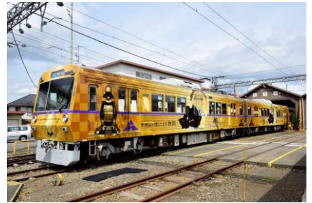
静岡鉄道 家康公ラッピングトレイン(イメージ)

行 程：新宿駅西口(7:30発／8月11・13日は7:00発)＝バンノウ水産(マグロ三味7種盛り膳の昼食)・・・エスパルスドリームプラザ(ショッピング)＝静岡鉄道 新清水駅(家康公ラッピングトレイン貸切乗車)+++静岡鉄道 新静岡駅経由・折り返し+++静岡鉄道 長沼駅(車庫見学)＝新宿駅西口(18:00着予定)