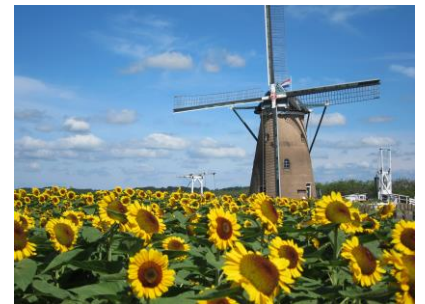
佐倉ふるさと広場(イメージ)

行 程：京橋駅(8:00／8:30発)＝成田ゆめ牧場(自由散策、ひまわりの観賞)＝アートホテル成田(昼食)＝佐倉ふるさと広場(風車のひまわりガーデン自由散策)＝京橋駅(17:00着予定)