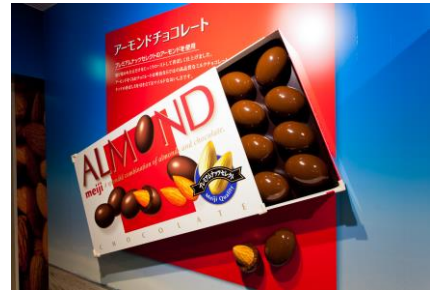
明治なるほどファクトリー東海(イメージ)

行 程：新宿駅西口(8:00発)＝明治なるほどファクトリー東海(案内人付工場見学)＝焼津さかなセンター(焼津選べる10種海鮮丼の昼食)＝(株)田丸屋本店(試食、ショッピング)＝新宿駅西口(18:00着予定)