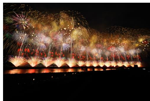
長岡まつり大花火大会(イメージ)

長岡まつり大花火大会では、開花幅約650mの「正三尺玉」や、打ち上げ幅2kmにも及ぶ「復興祈願花火フェニックス」が見どころで、カメラに収まらないほど大きく咲き誇る花火をご覧ください。また、大曲花火大会は、昨年設けられていた会場内の飲食の制限が撤廃されて4年ぶりの通常開催となり、約1万8000発が打ち上げられる予定です。はとバスツアーでは、専用観覧席や花火観賞後の宿泊がセットになっているため、どなたでもお手軽に花火大会をお楽しみいただけます。