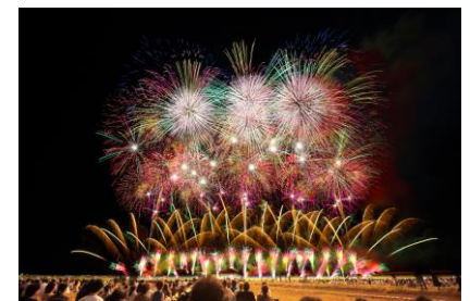
長岡まつり大花火大会(イメージ)

【2日目】水上温泉(10:00頃発)＝谷川岳ロープウェイ(往復乗車)＝谷川岳ドライブイン(昼食)＝群馬もも狩り(もも狩り2個＋試食付き)＝新宿駅(17:30着予定)