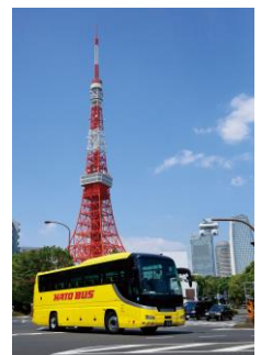
都内を走るバス(イメージ)

※感染防止対策詳細 https://www.hatobus.co.jp/news/taiou