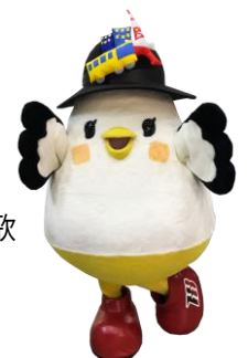
はとバス公式キャラクター「しゃぼぼ」

※コース詳細 https://www.hatobus.co.jp/course/2022/winter-early-spring/A7365