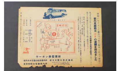
都内見学観光バスの運行開始を知らせるチラシ(1949年)

「はとバス謝恩コース 発車オーライ！ ～明るく明るく東京の街を走るのよ～」コースは、東京の観光名所を約3時間40分で巡ります。東京湾クルーズの船内では、創業当初のチラシなど、普段は公開していない、当社の歴史を辿る貴重な資料を特別展示いたします。また、東京タワーでは、はとバス公式キャラクター「しゃぼぼ」と、東京タワー公式キャラクター「ノッポン」が登場し、お客さまをお迎えします。