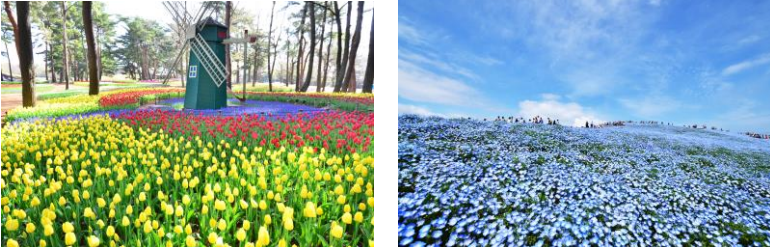
国営ひたち海浜公園(イメージ)

行程:上野駅浅草口(10:30 発)＝常磐道または東関道＝国営ひたち海浜公園(チューリップやネモフィラの観賞、約 3 時間のたっぷり滞在♪)＝上野駅(18:30 着予定)