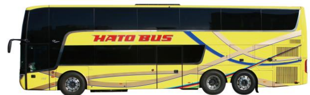
アストロメガ新車両(外観)