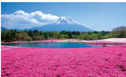
富士芝桜まつり(イメージ)

行程:新宿駅西口(8:00 発)＝中央道＝山梨マルスワイナリー(見学、試飲、ショッピング)＝ダイヤモンドテーブル(ビュッフェスタイルの昼食)＝富士芝桜まつり(自由見学、富士山と芝桜の競演が美しい)＝みはらしの丘みたまの湯(入浴、温泉でさっぱり)＝新宿駅(19:00 着予定)