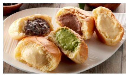
八天堂くりむ(イメージ)