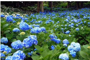
東京ドイツ村 6 月頃(イメージ)

行程:新宿駅西口(9:00 発)＝東京湾アクアライン＝八天堂きさらづ(くりむぱん工場の見学、パン生地づくり体験、1 個お土産付)＝オークラアカデミアパークホテル(ハーフバイキングの昼食)＝袖ヶ浦公園(花菖蒲等季節の花観賞)＝東京ドイツ村(入園、約 3 万株アジサイ等花観賞)＝道の駅木更津うまかつの里(ショッピング)＝新宿駅(18:00 着予定)