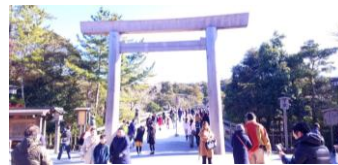
伊勢神宮(イメージ)

行程:【1 日目】浜松町(12:00 発)=東名道=湖西市内(16:00 頃着、宿泊地:ホテルルートイン浜名湖) 【2 日目】湖西市内(25:30 頃発)=豊川稲荷(初詣)=伊勢湾フェリーから洋上初日の出(伊良湖港～鳥羽港)=伊勢神宮・内宮(初詣)=東京駅(19:00 着予定)