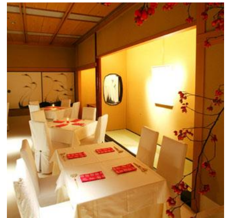
「花蝶」店内 (イメージ)

行程：東京駅丸の内南口(15:30 出発)＝将門の首塚(車窓)＝谷中全生庵(幽霊画鑑賞)＝花蝶(夕食/講釈師による立体怪談)＝東京駅丸の内南口(18:50 着予定)＝銀座キャピタルホテル(19:00 着予定)