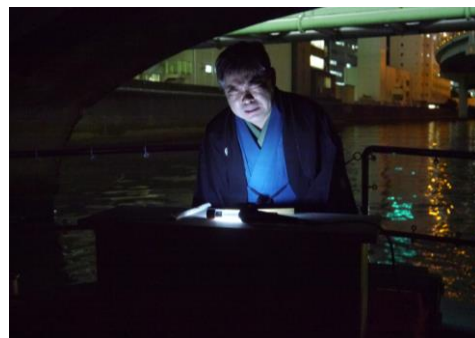
怪談クルーズ(イメージ)