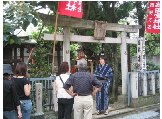
四谷於岩稲荷 (イメージ)

行程：東京駅丸の内南口(14:20 出発)＝四谷於岩稲荷(四谷怪談のモデル、お岩さんを祀っている神社)＝谷中全生庵(幽霊画鑑賞)＝根岸「笹乃雪」(豆富料理の夕食)＝将門の首塚(日本三大怨霊のひとつ)＝日本橋“夜の怪談クルーズ”(夜の運河探検と怪談噺)＝東京駅丸の内南口(21:00 着予定)＝銀座キャピタルホテル(21:10 着予定)