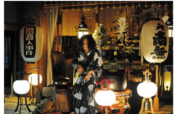
怪談の夕べ (イメージ)

行程：東京駅丸の内南口(17:20 出発)＝浅草観音(参拝)…浅草「米久」(牛なべの夕食/日本酒又はビール、又はソフトドリンク1本付)＝両国 回向院「怪談の夕べ」(お寺で聞く怪談の夕べ)＝東京駅丸の内南口(21:50 着予定)＝銀座キャピタルホテル(22:00 着予定)