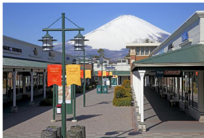
御殿場プレミアム・アウトレット(イメージ)