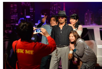
マダム・タッソー(イメージ)