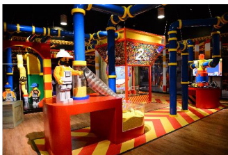
レゴランド(イメージ)

行程：都内各ホテル(9:00 発)＝東京ワンピースタワー(入場)＝ホテルグランパシフィック LE DAIBA「大志満」(昼食)＝マダム・タッソー(入館)＝レゴランド・ディスカバリー・センター東京(入場)＝各ホテル(18:00 頃着)