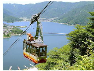
カチカチ山ロープウェイ(イメージ)