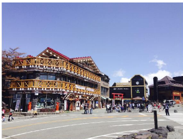
富士山五合目(イメージ)

行程：新宿駅東口(8:40 発)＝富士ビジターセンター＝富士山五合目(散策／昼食)＝河口湖・カチカチ山ロープウェイ(往復乗車)＝御殿場プレミアム・アウトレット(ショッピング)＝新宿駅西口(19:00 頃着)