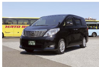
ハイヤー(イメージ)