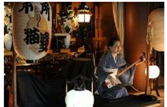
劇団檸檬座公演（イメージ）