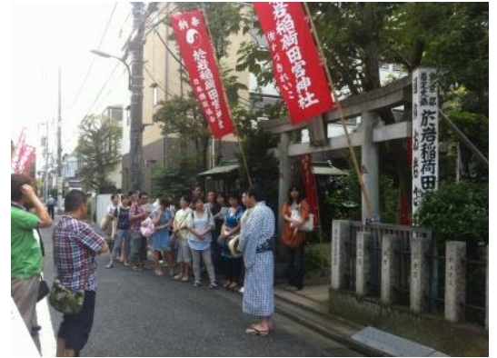
お岩稲荷での案内（イメージ）

行程：東京駅丸の内南口（14：20 出発）＝四谷お岩稲荷（四谷怪談のモデル、お岩さんを祀っている神社）＝谷中全生庵（幽霊画鑑賞）＝根岸「笹乃雪」（豆腐料理の夕食）＝将門の首塚（日本三大怨霊のひとつ）＝日本橋 夜の怪談クルーズ（夜の運河探検と怪談噺）＝東京駅丸の内南口（21：00 着予定）＝銀座キャピタルホテル（21：10 着予定）