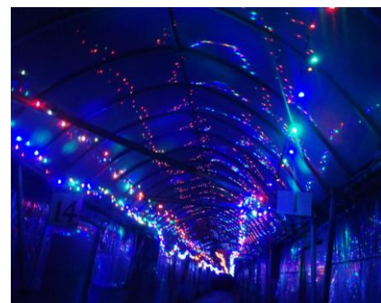
ナイトイチゴ狩り(イメージ)

今年はひと味変わったイチゴ狩りを発表します。栃木のイチゴ狩りでは電飾が光る中で夜にイチゴ狩りを楽しむ「ナイトストロベリー」のコースや、高級品種のイチゴブランド、「スカイベリー」の食べ放題が楽しめるコースを発表します。また、千葉のイチゴ狩りでは8種類以上のイチゴを食べ比べ、さらに白・黒・桃イチゴの試食が楽しめるコースを発表します。合計43コース発表し、8,500名の集客を目標とします。