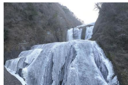
袋田の滝・氷瀑(2月頃)

冬の風物詩である氷瀑や樹氷のコースを3コース発表します。この時期しか見られない景色は人気が高く、寒景色を楽しんだ後は温泉や炉端焼きで温まったり、季節の花のロウバイを見るなど、寒い中でもお楽しみいただけるコースを発表します。