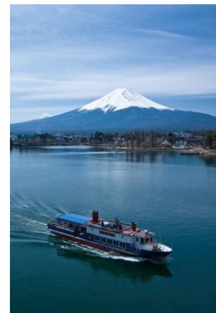
河口湖遊覧船(イメージ)