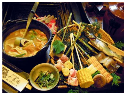
山麓園の昼食(イメージ)