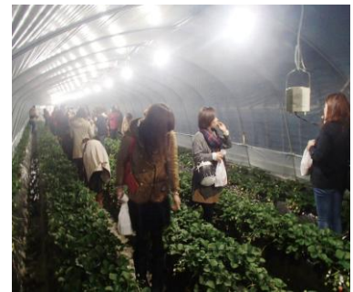
ナイトイチゴ狩り(イメージ)