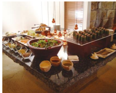
石の蔵・昼食(イメージ)