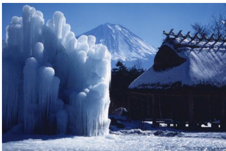
西湖の樹氷(イメージ)

行程：新宿駅西口(8:30 発)＝中央道＝西湖野鳥の森公園(見学。樹氷まつり開催中！)＝河口湖遊覧船アンソレイユ号(約 20 分の富士山の眺めが抜群のクルーズ)＝山麓園(古民家であったか炉端焼き&ほうとうのお食事)＝岡田紅陽写真美術館(入館。学芸員による案内付)＝忍野八海(自由散策)＝新宿駅(19:00 着予定)