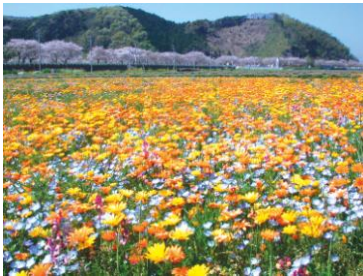
松崎お花畑(イメージ)