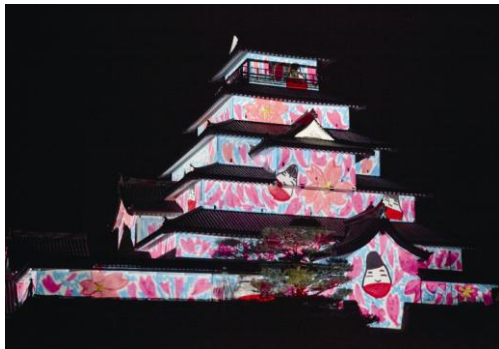
鶴ヶ城プロジェクションマッピング(昨年イメージ)

【二日目】芦ノ牧温泉(10:00 頃発)＝会津酒造歴史館(見学、試飲。ショッピング)＝喜多方(自由食)＝北会津イチゴ 狩り(食べ放題)＝東京駅(20:30 着予定)