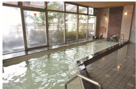
RAKO華乃井ホテル ゼロ磁場の湯