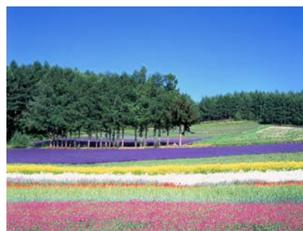
ファーム富田(イメージ)