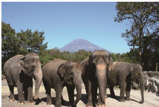
富士サファリパーク(イメージ)