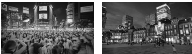
榎本 佳嗣 ‘Tokyo at night.’ (2階客室)