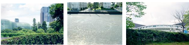
河野 翔大 ‘Around the corner’ (4階客室)