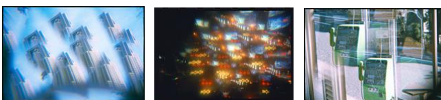
Takako Noel ‘東京のラブ&ピース’ (8階客室)