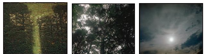
鳶村 吉祥丸 ‘Unusual Usual’ (5階客室)