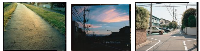
トヤマ タクロウ ‘flat features’ (3階客室)