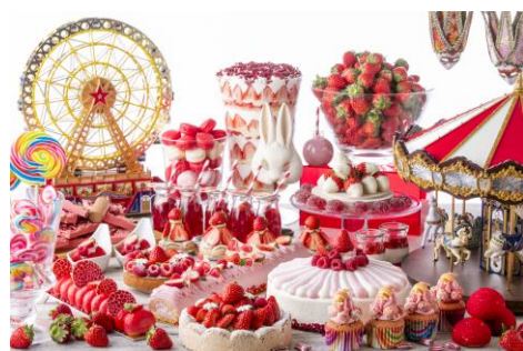
マーブルラウンジデザートbuffet(イメージ)

行程：東京駅丸の内南口(12:10 発)＝皇居・国会ドライブ＝六本木ヒルズ・東京シティビュー(展望)＝ヒルトン東京「マーブルラウンジ」(ストロベリーデザートbuffet)＝東京駅丸の内南口(16:20 終了)