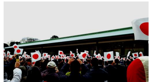
一般参賀（イメージ）

2016年8月に天皇陛下が生前退位を表明されたことが報道され、一般参賀の需要が高まり、昨年度、一般参賀コースは3コースで473名が利用しました。（前年比149.2%）2017年は眞子さまが婚約を発表されるなど、ニュースで皇室関連の話題を目にする機会が多く、今年度はさらなる需要を見込んでおります。昨年度は1週間前にはすでに全てのコースが完売し、キャンセル待ちやお断りをするのがございましたが、今年度はホテルでのランチや初詣等を組み合わせたコースなど、全5コースに増やし、最多670名さままでご乗車いただけるようご用意いたしました。スタッフが会場までお連れしますので、一般参賀の参加が初めての方でも気軽にご利用いただけます。