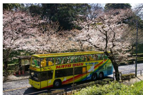
東京さくら回廊(イメージ)

行程：東京駅丸の内南口(3/26～4/4 は 8:00～20:00 までの毎時 00 分と 30 分発)～北の丸公園(皇居のお堀に咲く桜を車窓から)～靖国神社(東京桜名所の代名詞)～外堀通り(お堀沿いに咲く桜並木)～千鳥ヶ淵(桜のトンネルをオープンバスで)～東京駅(各出発 1 時間後着予定)