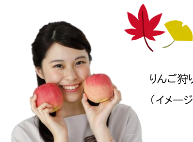
りんご狩り (イメージ)