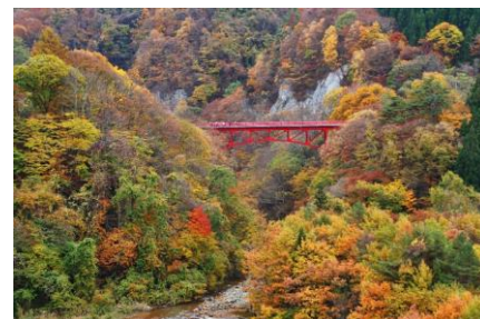
松川渓谷(イメージ)

今年も紅葉観賞だけでなく、温泉、雲海、星空、グルメ、フルーツ狩り、拝観券付寺社参拝など盛りだくさんの内容の紅葉コースを発表します。長野県松川渓谷や上田城跡公園の紅葉と合わせて、ホテル展望デッキから星空や雲海を見渡すことができるコース、福島県で鶴ヶ城の紅葉や熱塩温泉を楽しむコースなど全40コースをご用意しました。