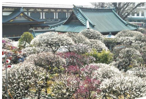
湯島天神イメージ