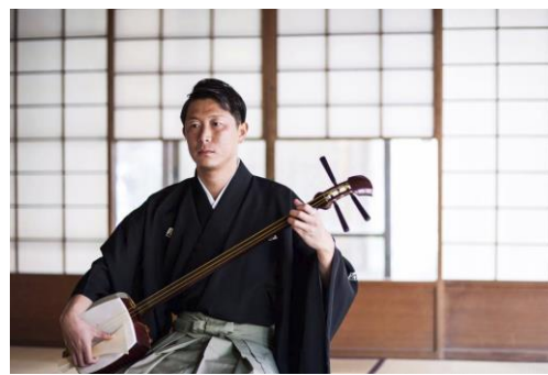
荻江節三味線演奏イメージ