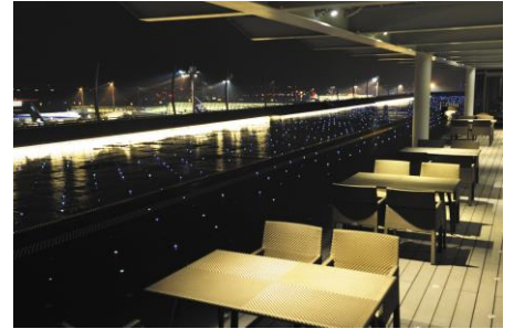
羽田空港国内線第二ターミナルイメージ

行程: 東京駅丸の内南口(17:20 発)＝目黒川みんなのイルミネーションクルーズ(乗船・40 分)＝羽田エクセルホテル東急「フライヤーズテーブル」(洋食の夕食・ワンドリンク付・50 分)＝羽田空港国内線第二ターミナル(自由散策・40 分)～レインボーブリッジ～歌舞伎座～銀座～東京駅(21:50 頃着)＝銀座キャピタルホテル(22:00 頃着)