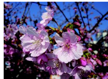
三浦海岸 河津桜イメージ