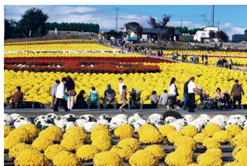
小菊の里(イメージ)