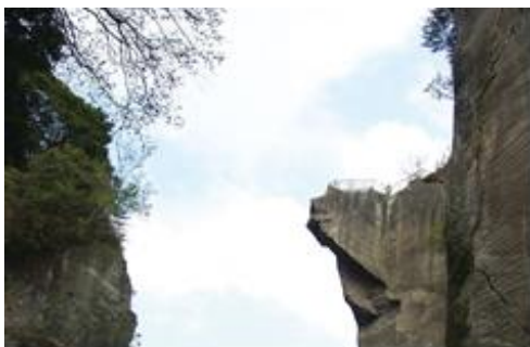
鋸山地獄のぞき・日本寺(イメージ)

行程:各地発(浜松町・松戸駅西口・南越谷駅南口・上野駅浅草口)=東京湾アクアライン通行・海ほたるパーキングエリア(休憩)=鋸山地獄のぞき・日本寺(参拝、高さ31mの大仏様や千葉の絶景地獄のぞき)=ザ・フィッシュ(手づかみシーフードの昼食)=道の駅保田小学校(廃校をリニューアルした道の駅でショッピング)=中の島大橋(日本一高い歩道橋、工場地帯や東京湾の景色が抜群の話題のスポット)=江川海岸(満潮時には水中に電柱が映し出される幻想的で珍しい風景が見られます)=首都高速から川崎工場夜景ドライブ=各地着