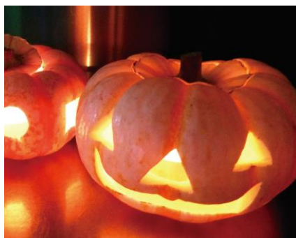
ランタン作り体験(イメージ)