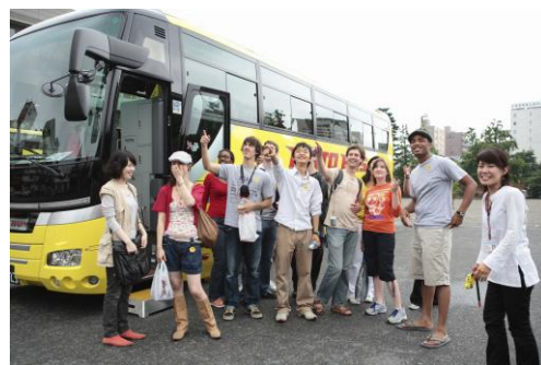
外国人向けバスツアーイメージ

以上、2015年度はバス業界を取り巻く環境、外的要因により邦人コースが低調でありました。今年度も引き続き安全確保に関する一層の体制強化に努め、豊洲新市場の開場や迎賓館一般公開、国立西洋美術館など、新しい観光資源を取り入れた魅力的な企画を行い、需要の掘り起こしを図ります。