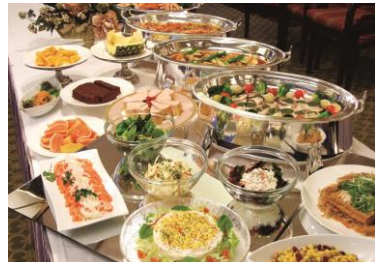
カジュアルバイキング(イメージ)