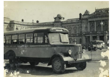
1949年頃の迎賓館と当時のはとバス

また、バスツアーでは弊社が初めて、 湘南モノレール車両基地 の見学を行う夏休み特別企画を発表いたします。オープン時間前の原鉄道模型博物館の見学や、湘南モノレールの乗車を行い、湘南モノレール深沢車庫にて、運転室見学や車掌体験を実施します。鉄道好きだけでなく、大人も子どもも楽しめるファミリー向けのコースです。