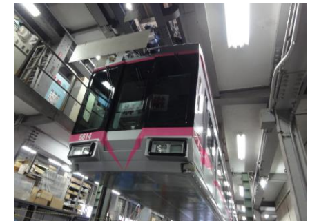
湘南モノレール車両基地(イメージ)