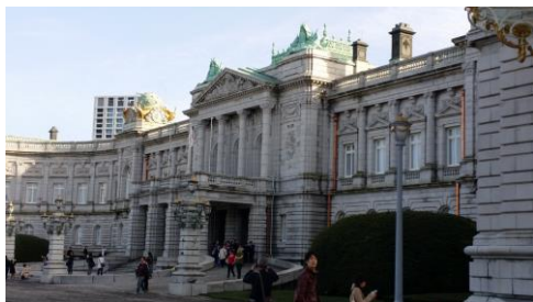
迎賓館赤坂離宮(イメージ)

行程：東京駅丸の内南口(9:50 発)＝国会議事堂(衆議院見学・60 分)＝東京ドームホテル 43 階「アーティスト カフェ」(ホテルの最上階でパノラマランチ！はとバスオリジナルメニュー「萬幻豚ロース肉の炭火焼きレモン添え、又ははとバスオリジナルのメイン料理・前菜・サラダ・ドルチェのbuffet付・60 分)＝迎賓館赤坂離宮(前庭の一般公開、本館を間近で見学・50 分)＝東京ステーションホテル「アトリウム」(普段は宿泊者のみが利用できる東京駅中央最上部に位置する「アトリウム」にてティータイム。東京ステーションホテルにまつわる映像をお楽しみください・50 分)～現地解散(16:10 頃予定)