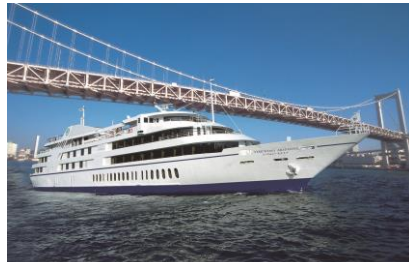
東京湾クルーズ(イメージ)