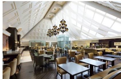
東京ステーションホテル「アトリウム」(イメージ)