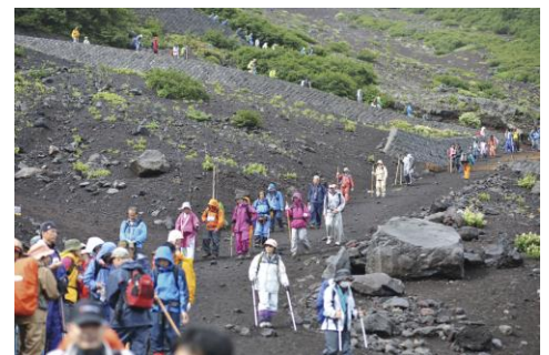
富士登山(イメージ)

富士山八合目(23:30 頃発)…徒歩約 4 時間…富士山山頂(ご来光)…徒歩 4 時間…富士山五合目＝山中湖温泉「紅富士の湯」＝中央道＝新宿駅経由＝東京駅経由＝銀座キャピタルホテル(17:30 頃着予定)