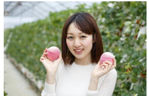
8月桃狩り(イメージ)