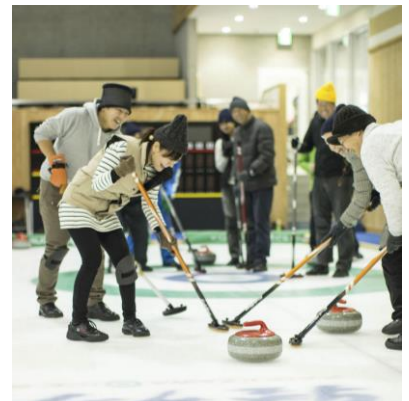
カーリング体験(イメージ)

ルールを詳しく学んでみたい、本物の道具を使ってプレイを体験してみたい、という方が多いことから、本ツアーでは、インストラクターの指導と、カーリングシューズ・専用ブラシの貸し出しを含んでいます。また、都内近郊で充実したカーリング施設は多くありませんが、利用する「軽井沢アイスパーク」は、国際大会の開催が可能な、6レーンの日本最大級ホールとなっており、広々とした空間で快適にお楽しみいただくことができます。