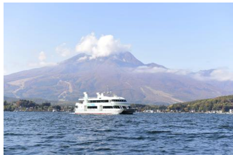
野尻湖遊覧船(イメージ)