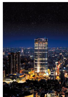
六本木ヒルズ(イメージ)