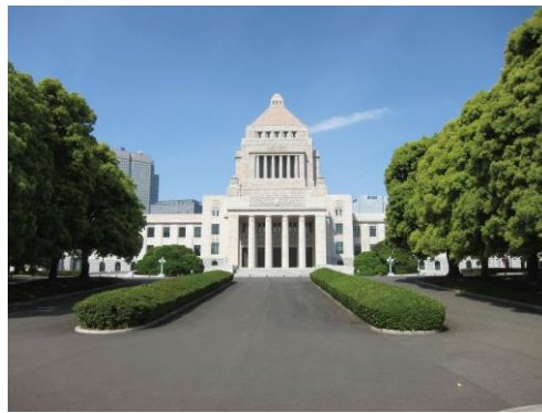
国会議事堂(イメージ)