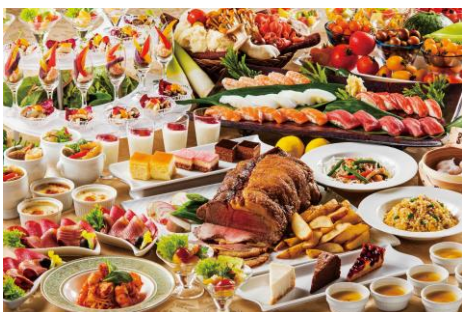
バイキング(イメージ)