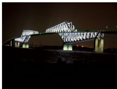
東京ゲートブリッジ(車窓/イメージ)