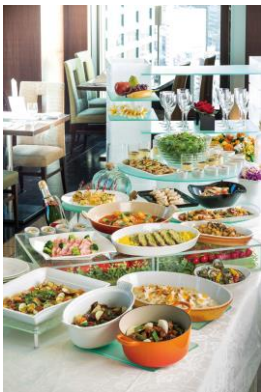
バイキング(イメージ)