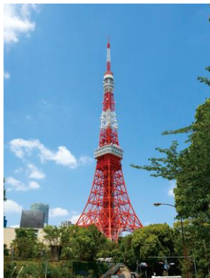
東京タワー(イメージ)