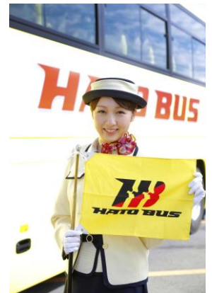
第5代イメージガール