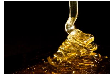
ハニーイチゴ狩り(イメージ)