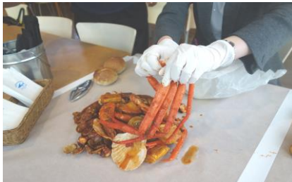
手づかみシーフードの昼食(イメージ)

行程: 各地(8:00～8:30 発)＝東京湾アクアライン＝大竹養蜂場(ハチミツ工房の見学、試食)＝マザー牧場(かわいい動物のショーやふれあい)＝ザ・フィッシュ(手づかみシーフードの昼食)＝南房総イチゴ狩り食べ放題(美容成分たっぷりのハチミツをつけてハニーイチゴ狩り♪)＝各地(18:30～19:00 着予定)