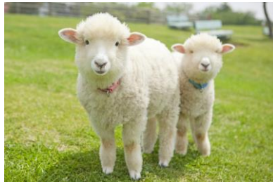
マザー牧場(イメージ)