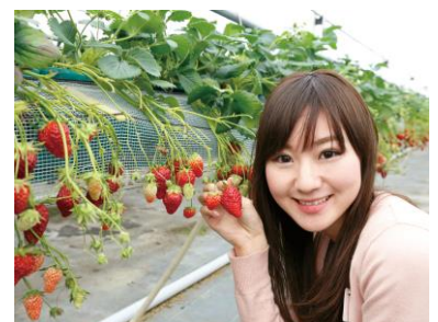
イチゴ狩り(イメージ)