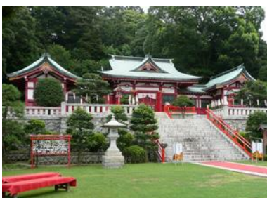
織姫神社(イメージ)

行程: 新宿駅西口(8:20 発)＝東北道＝製粉ミュージアム(入館、お好み焼き粉のお土産)＝ヴィーヴル(フレンチの昼食)・・・美人弁天(参拝、心穏やかに優しく美しくなる「美人証明書」を発行)＝織姫神社(恋人の聖地としても認定された縁結びの神様)＝大麦工房ロア(ショッピング、大麦ダクワーズのお土産)＝栃木イチゴ狩り(食べ放題、スカイベリーの試食付)＝新宿駅(18:30 着予定)