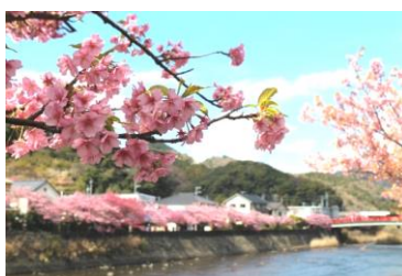
河津ざくら(イメージ)