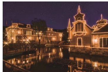
オルゴールの森 外観(イメージ)