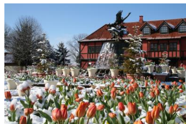
船橋アンデルセン公園(イメージ)