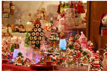
オルゴールの森(イメージ)