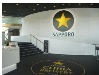
サッポロビール千葉工場(イメージ)

行程：上野駅浅草口(9:30 発)＝船橋アンデルセン公園(入園、アイスチューリップの観賞)＝千葉ビール園(バーベキューの昼食)・・・サッポロビール千葉工場(黒ラベルのうまさの仕組みを知るツアー、生ビール試飲 2 杯)＝千葉ポートタワー(案内人付で展望室から千葉の眺めをご案内)＝東京ドイツ村(イルミネーション観賞)＝上野駅(20:00 頃着)