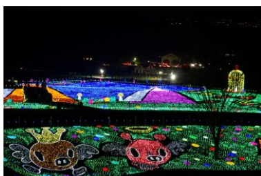
東京ドイツ村(イメージ)