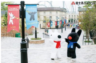
リサとガスパールタウン(イメージ)

行程：新宿西口(9:30 発)＝シャトー勝沼(ホットワインの試飲、ショッピング)＝長寿村権六(ほうとうと煮貝の昼食)＝桔梗屋(信玄餅つめ放題、ショッピング)＝富士飛行社(富士山周遊フライトアトラクション)＝リサとガスパールタウン(見学)＝河口湖オルゴールの森(クリスマスコンサートとイルミネーションの観賞)＝新宿駅(20:00 頃着)