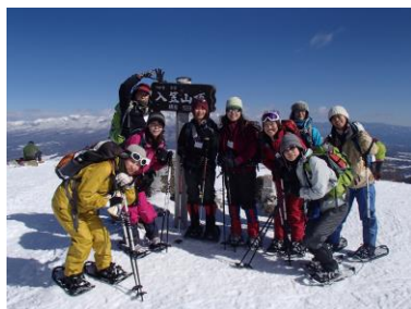
スノーシュー(イメージ)

行程：新宿西口(7:30 発)＝富士見パノラマリゾートロープウェイ(乗車)・・・入笠湿原・・・入笠山山頂・・・ロープウェイ(乗車)＝ゆーとろん水神の湯(温泉でさっぱり)＝新宿駅(19:30 頃着)