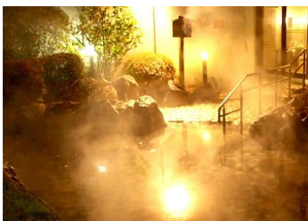
露天風呂(イメージ)

★冬の澄んだ空気が気持ち良い那須高原で、クリスマス気分を盛り上げる盛りだくさんのツアーです。