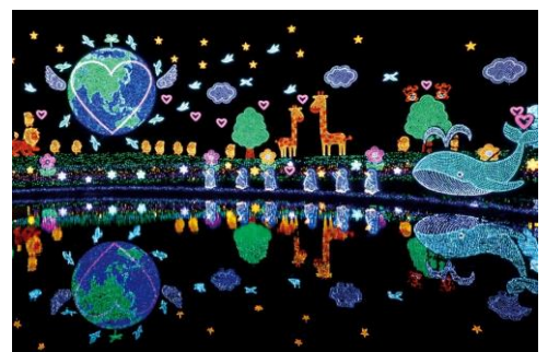
あしかがフラワーパーク(2014年)