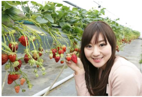
イチゴ狩り(イメージ)