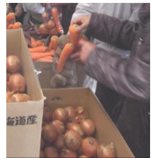
野菜詰め放題(イメージ)