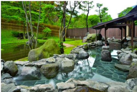
露天風呂(イメージ)

★12/23、25、28、1/4、5、7、11 発はお得な料金の「スペシャルDAY」となります。