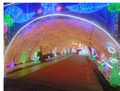
時之栖光のトンネル(2014年)

各地で行われているイルミネーションは、閑散期となる冬の観光の目玉として、おとなから子どもまで人気の高い見学地です。昨年の日帰りツアーでは15コース8,032名のご利用がありました。宿泊では、2コースで393名が利用しました。今冬の宿泊コースでは、あしかがフラワーパーク、御殿場時之栖などの人気イルミネーションに立ち寄るクリスマス新ツアーなどを増やし、全7コースで800名のご利用を目標とします。